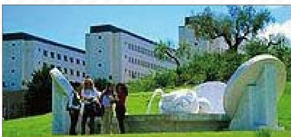
Università di Chieti